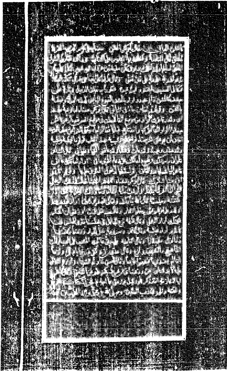
الصفحة الأخيرة من (ل)