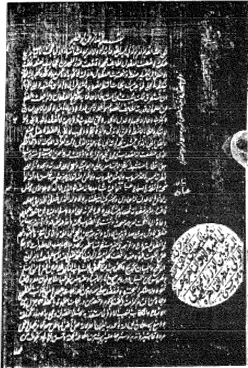
الصفحة الأولى من نسخة قوله (ق)